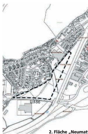
2. Fläche „Neumatte“