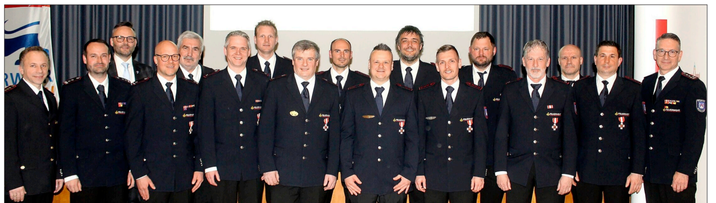
Gruppenbild aller Geehrten.